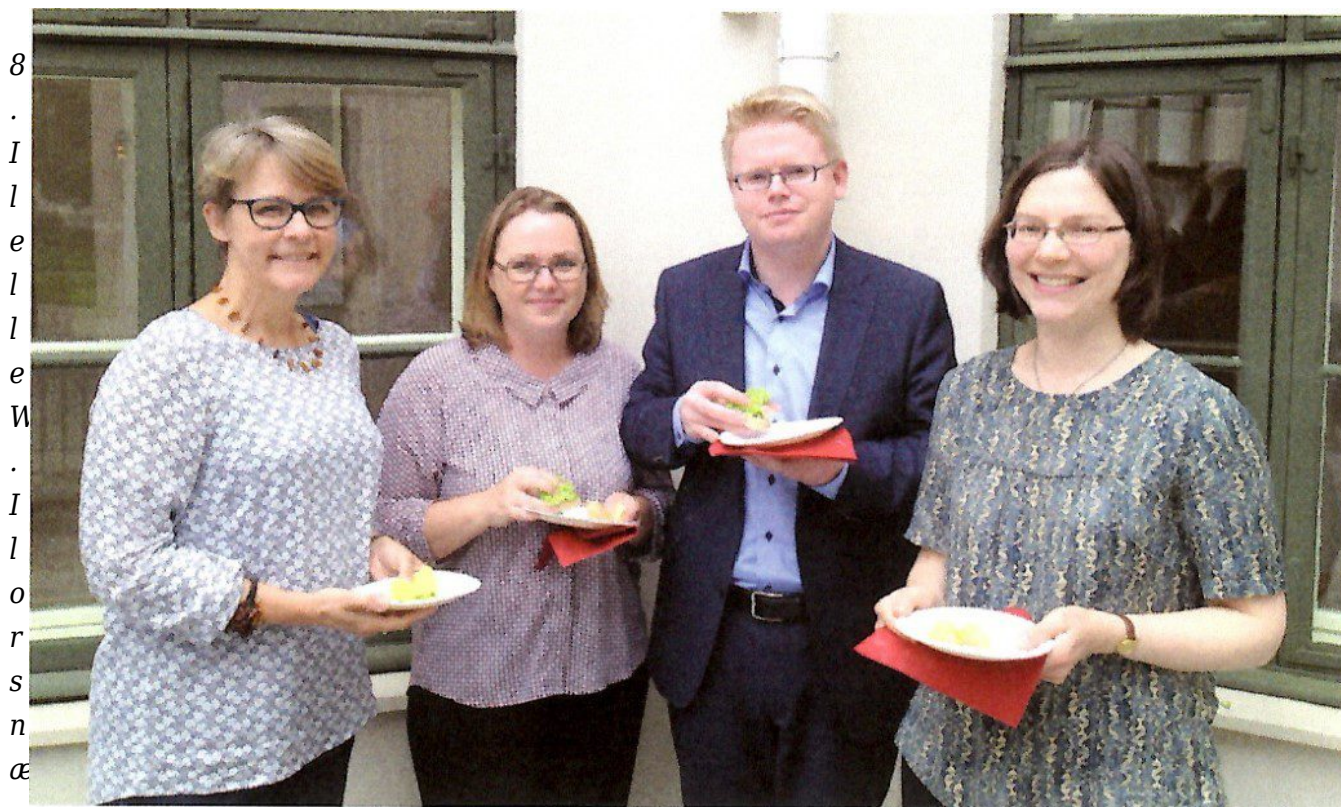
från Den kgl. Mønt og Medaillesamling i Köpenhamn,

Det formella unionsmötet avslutades med att Island utsågs till ordförandeland de nästkommande tre åren. Ny unionsordförande blev därför Eirfkur Lindal från Myntsafnara- félag Islands. Foto 2. Väl mött i Reykjavik år 2020!