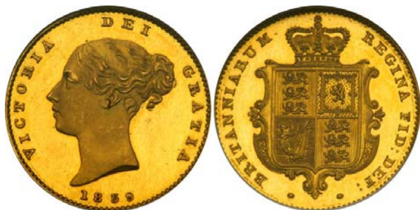
Figur 2: Det kongelige skjold er uforandret siden dronning Victoria overtok tronen. Halv sovereign 1839 i gull. Advers: dronning Victoria; revers: det kongelige våpenskjold.

Dagens kongelige skjold ble innført da dronning Victoria besteg tronen i 1837 (figur 2). Det er delt i fire kvadrater der heraldiske symboler for kongerikene England, Skottland og Irland er plassert. Kongeriket England er representert med tre løver passant guardant , eller liggende og voktende. Skjoldbunnen er rød, og løvene er i blek gull. For kongeriket Skottland er det en løve rampant , eller stående, innenfor en dobbel Treasure flory counterflory , eller doble indre skjoldkanter med fleur de lys (liljer). Her er skjoldbunnen gull, og løven og detaljene ellers er i rødt. Løven er et tradisjonelt symbol på kongens makt, og det er et symbol vi også kjenner fra norsk historie. Harpen i den ene kvadranten representerer kongeriket Irland. Skjoldbunnen er blå, og harpen er i gull med sølvstrenger. Harpen er et mer uvanlig symbol, men har røtter i irsk historie og kultur. Den har vært et kongelig symbol siden kong Henrik VIII erklærte seg som konge over Irland i 1541.