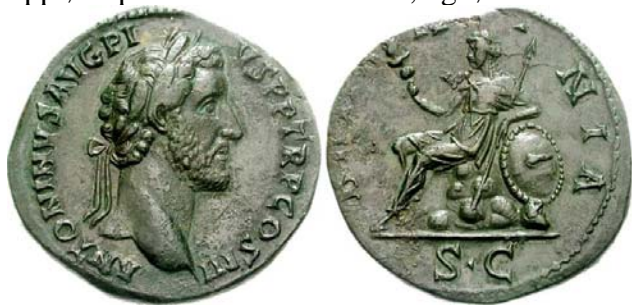
Figur 3: Britannia slik hun ble framstilt på en bronsesestertius preget under keiser Antoninus Pius i 143-44 e.Kr. RIC III 742.

De heraldiske symbolene har en lang tradisjon på britiske mynter, men den nye mynttrekken betyr også at engelskmennene tar farvel med et kjært symbol: Britannia pensjoneres fra sirkulasjonsmyntene. Dette har allerede vakt reaksjoner i britisk presse. Britannia dukket opp som myntmotiv under keiser Hadrian i 119 e.Kr. Myntene ble antagelig produsert etter at et opprør i provinsen var slått ned, og før keiseren selv besøkte øyene.