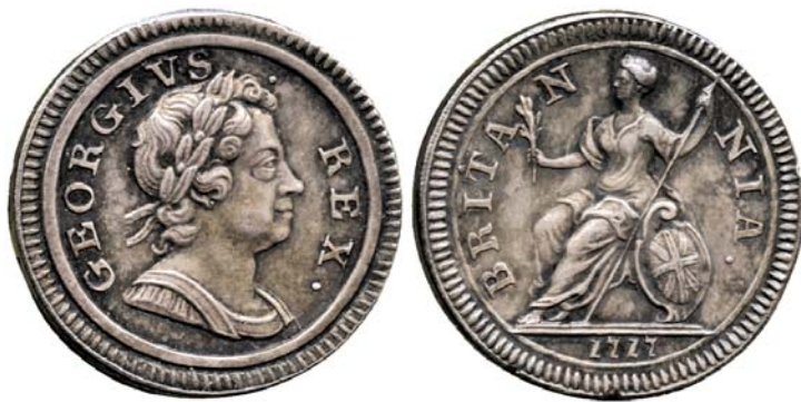
Figur 4: Britannia slik hun ble framstilt på et sølvavslag av en farthing fra 1717. Adversen viser George I, og reversen Brittania.

olivengren (figur 4). Avisa Daily Telegraph mente det var en siste fornærmelse mot ”stakkars, misbrukte Britannia” at hun ble kastet ut av myntrekka. Det er nok en holdning mange numismatikere deler, og det skal bli spennende å se hvordan de nye myntene blir mottatt.