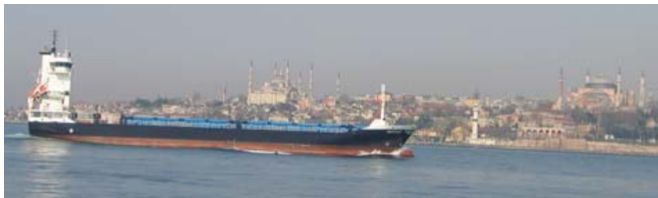
Figur 2: Stor tanker på vei inn Bosporos forbi Istanbul idet den passer den blå moské og Hagia Sofia.

Spør du tyrkere om Ataturk, synes de alle å ha stor respekt for ham, og han er et forbilde for dem. Under en prat med en eldre tyrker om moderne tyrkisk politikk, er han nølende på spørsmål om Tyrkia skal inn i EU, men han er fornøyd med at Tyrkia står i Nato.