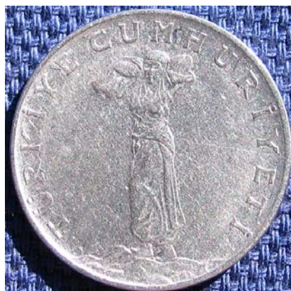
Figur 12 25 kurus 1963 med bondekvinne på adversen. Reversen har 25 kurus omgitt av hveteaks og en gren.