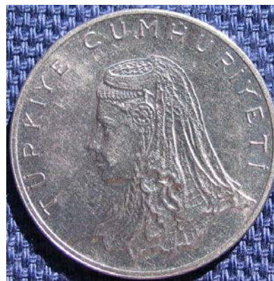
Figur 16 50 kurus 1975 i rustfritt stål med hode til en anatolisk kvinne på adversen.

I 1981 ble aluminiummynter introdusert med verdier fra 1 til 20 lira. Alle hadde Kemal Atatyrk på adversen (figur 3 og 17). Dette systemet holdt ikke lenge. I 1983 kom en serie mynter med nominaler opp til 500 lira. De ble preget i Cu-Ni eller Cu-Ni-Zn bronse.