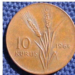
Figur 11 10 kurus 1964 i bronse. Adversen viser hveteaks. Reversen har nymåne og stjerne.