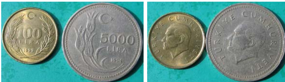
Figur 18 Plantemynter fra 1990-tallet med Kemal Ataturk på aversens. 100 lira 1990 med hveteaks og eikegren på reversen, og 5000 lira 1994 med tulipaner på reversen.

tidligere tradisjoner idet blomster kommer som motiv på reversen. 100 lira med hveteaks og eikeløv (figur 18), 5000 lira med tulipaner (figur 18), 10 bin lira med nellik (figur 19) og 25 bin lira med rose (figur 20). Alle som besøker Istanbul i april, skjønner at tyrkerne elsker blomster og dyrker tulipaner.