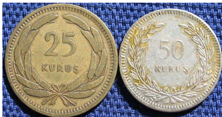
Figur 9 25 kurus 1949 og 50 kurus 1947 preget i messing og sølv. Begge har nasjonalsymbolet nymåne og stjerne på reversen.