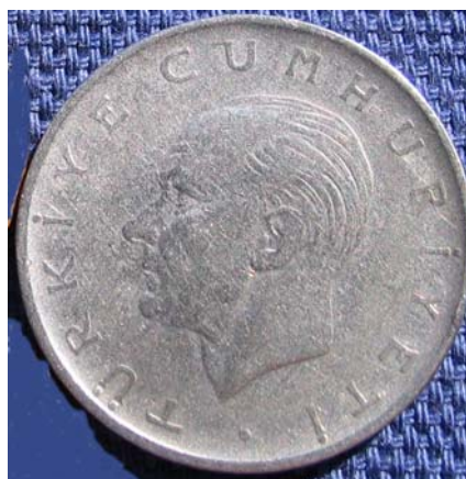
Figur 13 1 lira 1964 med Kemal Atatyrk på adversen.