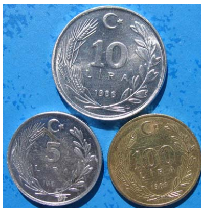
Figur 17 5 lira 1983 og 10 lira 1986 i aluminium, og 100 lira 1989 i aluminium-bronse, alle med Kemal Atatyrk på adversen.

I 1981 ble aluminiummynter introdusert med verdier fra 1 til 20 lira. Alle hadde Kemal Atatyrk på adversen (figur 3 og 17). Dette systemet holdt ikke lenge. I 1983 kom en serie mynter med nominaler opp til 500 lira. De ble preget i Cu-Ni eller Cu-Ni-Zn bronse.