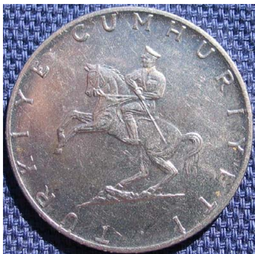
Figur 15 5 lira 1975 i rustfritt stål med Kemal Atatyrk til hest på adversen.

I 1967 - 1968 skjedde det en vektreduksjon (devaluering?) i myntene. Vekten på 1 lira i rustfritt stål sank fra 8 g til 7 g. Myntrekken ble beholdt frem til 1980. I denne perioden dukket for første gang 5 lira-mynt i rustfritt stål. Den hadde Kemal Atatyrk til hest på adversen og hveteaks/eikeløv på reversen (figur 15). 1980 var siste året med kurusmynter. Noen av de siste 50 kurusmyntene hadde hode til en anatolisk kvinne på adversen (figur 16).