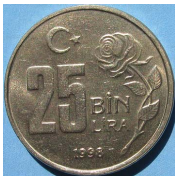
Figur 20 25 bin lira 1998 med en rose på reversen og Kemal Ataturk på aversens.