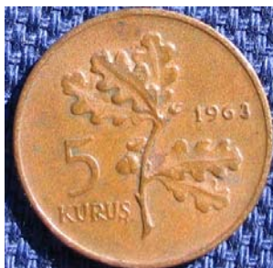
Figur 10 5 kurus 1963 i bronse. Adversen viser en gren av en eik. Reversen har nymåne og stjerne.

politikk. Samtlige av de nevnte myntene er nominalen omgitt av et hveteaks og en gren på reversen. Dette er standard revers som går igjen på storparten av myntene frem til 1990.