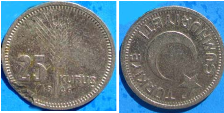
Figur 6 25 kurus 1946 med et hveteaks på adversen og symbolet for Tyrkias nymåne og stjerne på reversen.

I årene frem til 1959 var den høyeste nominal 100 kurus = 1 lira, og de største myntene ble preget i sølv. Politikken med at de tyngste myntene preges i sølv og enkelte jubileums- og minnemynter preges i gull er fortsatt standard praksis i Tyrkia. I årene fra 1934 til etter krigen i 1946 ble de lavere nominaler fra 1 kurus til 25 kurus preget i nikkel-bronse (figur 6). Mange av myntene hadde symbolet for Tyrkia, stjerne og månesigd, på adversen (figur 6). Kemal Atatyrk dukket opp på sølvmyntene allerede i 1934, og har vært en sentral skikkelse på myntene i hele republikkens historie. Det tredje hovedmotiv var hveteaks (figur 6). Paramynter ble preget i noen år under krigen. Det var 10 para i aluminium-bronse (figur 7).