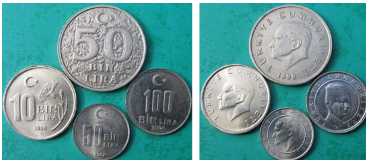
Figur 19 Bruksmynter fra rundt århundreskiftet med Kemal Ataturk på aversens. 10 bin lira 1998 og 2002, 50 bin lira 1998 og 100 bin lira 2004. 100 bin lira 1998 har en nellik på reversen.