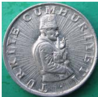
Figur 3: Kemal Ataturk som offiser under 1. verdenskrig. Adversen til 10 lira 1982 i aluminium.

Mustafa Kemal var en dyktig offiser (figur 3) og kjempet for sultanen under 1. verdenskrig /1/. Men til slutt ble Tyrkia slått, og de allierte delte Det osmanske riket. Grekerne tok øyer i Egeerhavet og satte seg fast i Lilleasia rundt Smyrna, nå Izmir. Tyrkerne måtte godta harde betingelser i freden ved Sevres i 1919. Men så de gikk til motangrep, og i 1923 laget de en republikk samtidig som de slo grekerne. Ved freden i Lausanne beholdt grekerne de fleste øyene i Egeerhavet, men ikke noe av Lilleasia. 1,5 million tyrkere i Hellas ble sendt til Tyrkia, og 3 millioner grekere ble sendt fra Tyrkia til Hellas, spesielt til Thrakia. Arkitekten bak denne ”folkeutvekslingen” var Fridtjof Nansen og Folkeforbundet.