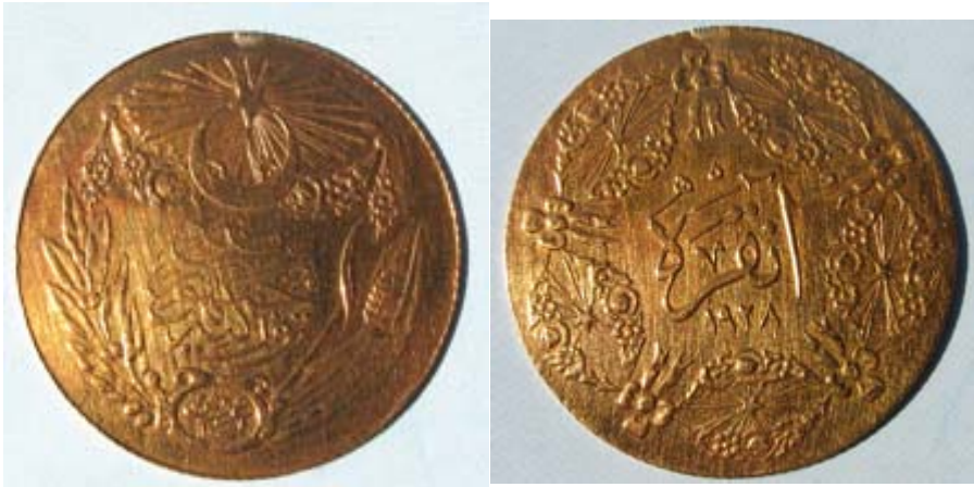
Figur 5 100 kurush 1928 i gull. Adversen viser Tyrkias symbol stjerne over en månesigd. Under er ekeløv og et hveteaks.

I 1929 gikk Tyrkia over til latinske bokstaver pluss noen spesielle tegn som ç uttales som ch, tilsvarende ş som uttales sh og ğ som uttales "yumuşak ge". De første myntene i dette systemet ble preget i 1934.