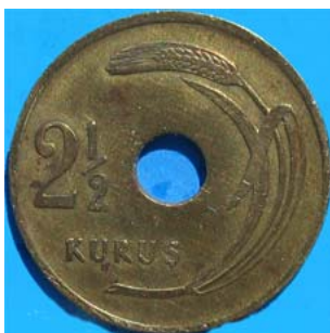
Figur 8 2 1/2 kurus 1949 med et bøyd kornaks på aversens. Mynten har hull.

I 1947 sank sølvmengden i liramyntene, og det ble preget en myntrekke som holdt seg frem til 1958, fortsatt med de største nominalene i sølv. I denne perioden hadde samtlige mynter nymåne og sigd på aversens (figur 8 og 9). De minste myntene, 1 og 2 1/2 kurus, hadde hull i sentrum og viste et bøyd hveteaks på reversen (figur 8). Disse myntene ble tatt ut av bruk i 1952. Alle de lettere myntene opp til 25 kurus ble preget i messing (figur 9), mens 50 kurus og 1 lira ble preget i sølv (figur 9).