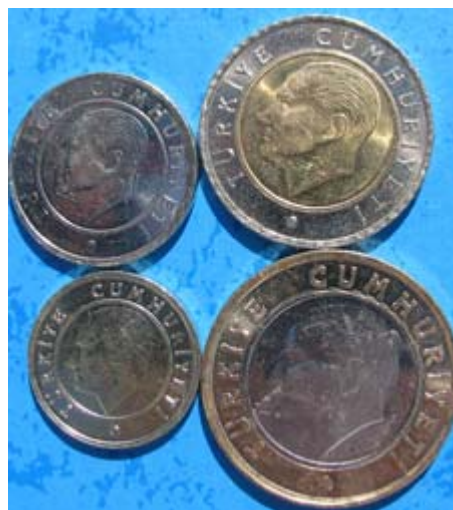
Figur 1: Advers og revers til 10 kurus, 25 kurus, 50 kurus og 1 lira preget i 2009. 50 kurusmynten viser hovedbroen over Bosporos i Istanbul. Kemal Ataturk er på reversen til alle myntene. 50 kurus og 1 lira er i bimetall.

I løpet av en ferieuke finner man fort ut at myntene i omløp er 5, 10, 25 og 50 kurus (figur 1) og 1 lira (figur 1). Alle myntene er preget i kobber – nikkel – sink - legeringer, og de høyeste valørene i bimetall. Det finnes også en 1 kurus mynt i messing, men den så vi lite til. Samtlige er preget med grunnleggeren Mustafa Kemal Ataturk på reversen og nominalet på adversen. Bare 50 kurusmynten er spesiell og viser den største broen over Bosporos.