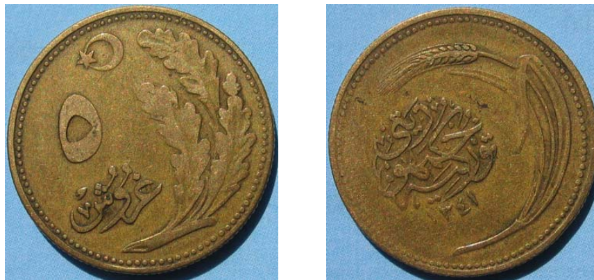
Figur 4: 5 kurus 1341AH (1922e.Kr.) med hvetaks på adversen og ekeløv på reversen.

Kemal Atatyrk arvet sultanenes myntsystem med 40 para = 1 kurus (kurush) /2/. Etter 1934 gikk Tyrkia over til et desimalsystem med 100 kurus = 1 lira, og lira som basis myntenhet. Som det vil bli demonstrert har Tyrkias mynttrekke ikke vært statisk, men den har vært i stadig endring på grunn av landets økonomiske problemer og inflasjon.