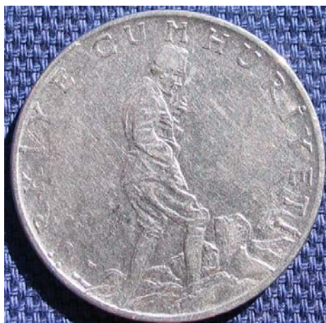
Figur 14 2 1/2 lira 1960 med en bonde på adversen. Reversen har 2 1/2 lira omgitt av hveteaks og en gren.