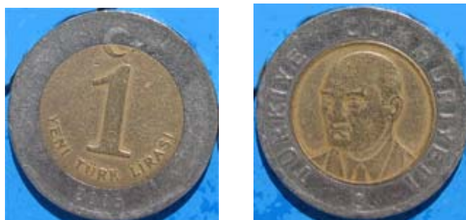
Figur 22 1 yeni lira 2005 med Kemal Ataturk på adversen, og nominal, nymåne og stjerne på reversen

å kalle myntene kurus og lira og sløyfet ”yeni”. Man kan kjøpe sjetonger til 1 lira 40 kurus for alle reiser med trikk og båt i Istanbul (2009). Prisen er den samme på buss. Det gjør det enkelt å være turist i byen. Småhandel med kastanjer, fisk eller frukt går med mynter. Går man derimot på restaurant, får man behov for sedler som finnes i verdi opp til 1000 lira. Underlig nok kan man også betale med Euro.