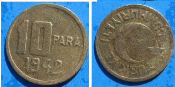
Figur 7 10 para 1942 med nymåne og stjerne på reversen.